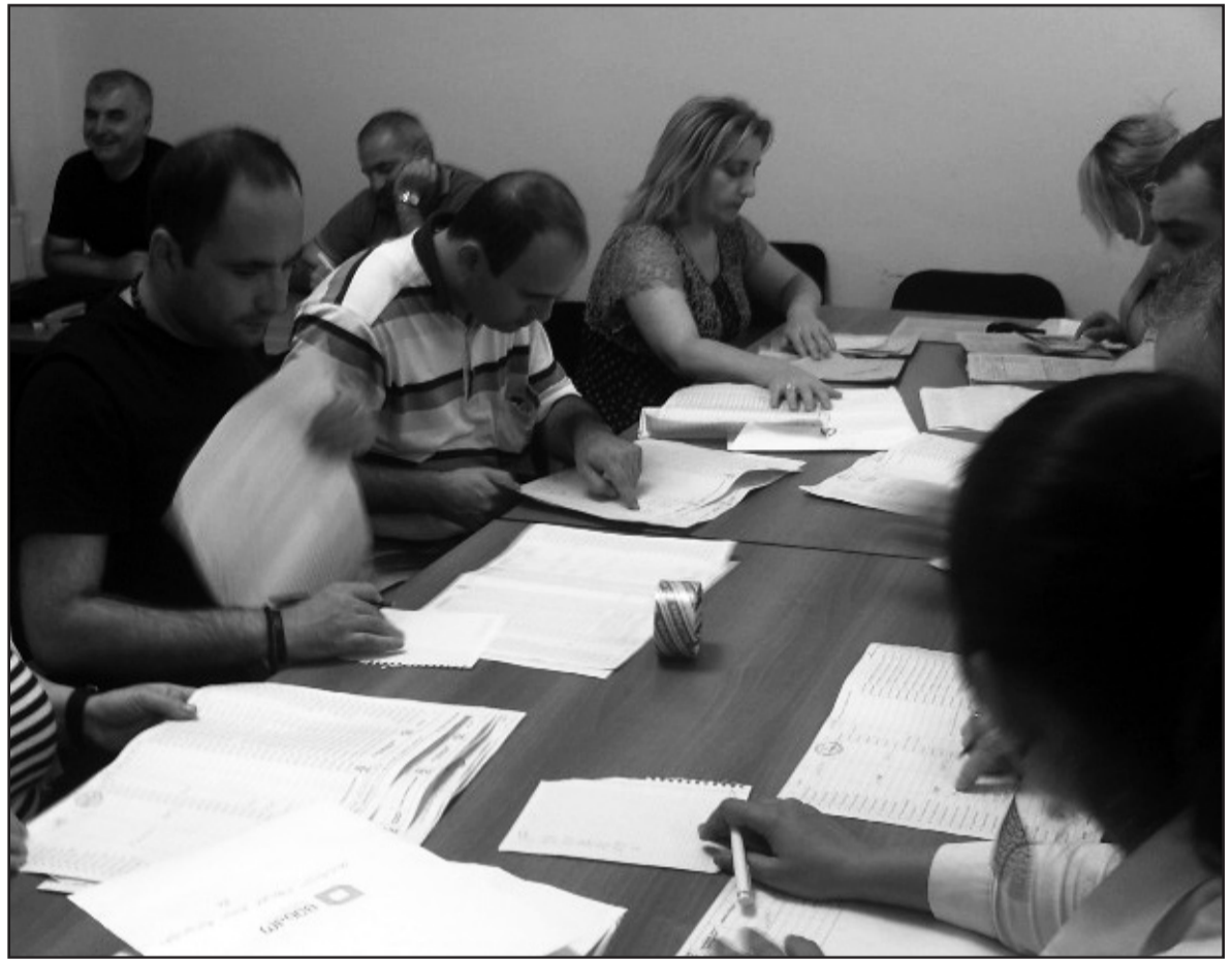
ქუთაისის საოლქო საარჩევნო კომისიამ 20-მდე საჩივარი განიხილა