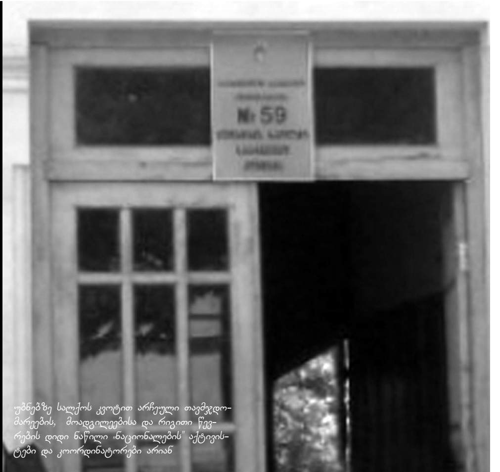
უბნებზე სალქოს კვლით არჩეული თავმჯდომარეების, მოადგილეებისა და რიგითი წევრების დიდი ნაწილი „ნაციონალების“ აქტივისტები და კოორდინატორები არიან

რა პრინციპით აკომპლექტებენ საარჩევნო ადმინისტრაციებს, რამდენად კვალიფიციური კადრები არიან კომისიებში და რამდენად მზად არის საოლქო კომისია და საარჩევნო უბნები საპარლამენტო არჩევნების ჩასატარებლად? - „ახალი გაზეთი“ ამ კითხვებით დაინტერესდა. როგორც აღმოჩნდა, ხშირ შემთხვევაში, საუბნო კომისიის წევრების გამოცვლას და სერთიფიკატს მმართველი პარტიიდან წამოსული დირექტივები ანაცვლებს. შესაბამისად, საუბნო კომისიებში საოლქოს კვლით არჩეულთა შორის მრავლად არიან „ნაციონალების“ კოორდინატორები და აქტივისტები, მათ შორის, საჯარო სამსახურში დასამუშავებული პირები.