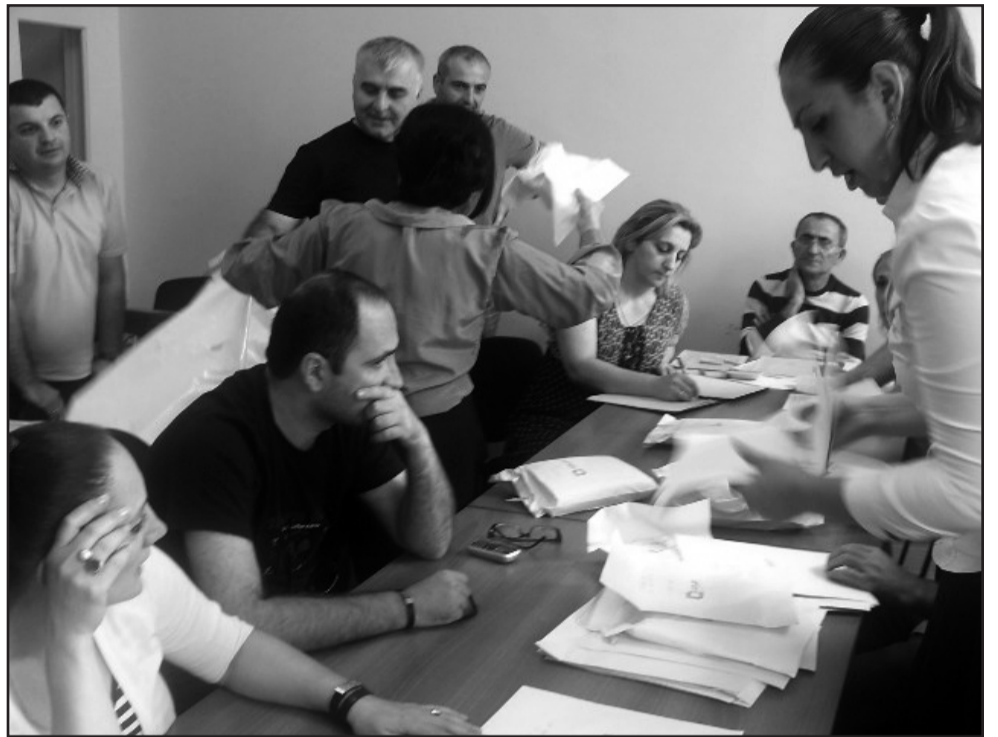
სარევიანი შემაჯამებელი ოქმები უბნის ბათილად ცნობის საფუძველი არ გამხდარა